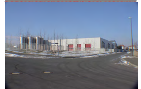
Außenansicht mit Granulat-Siloanlage